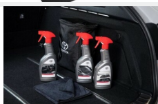
Zestaw kosmetyków samochodowych Toyota Kosmetyki