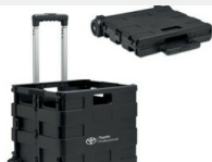
Skrzynka bagażowa Gadżety