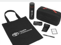
Zestaw prezentowy Professional Gadżety