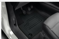
Dywaniki gumowe przednie Dywaniki / Wykładziny